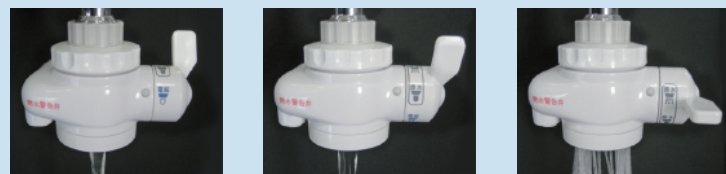
還元水・浄水ストレート 水道水ストレート 水道水シャワー